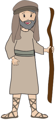
רוח ומעבדה קשה