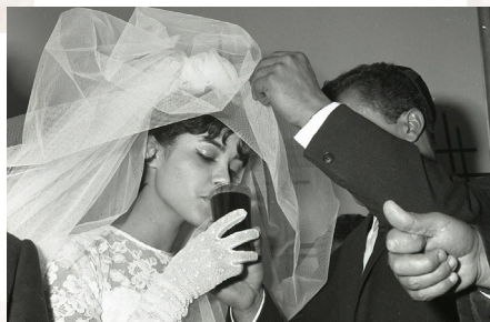
טקס נישואין, יוצאי תימן, ישראל (הספריה הלאומית)